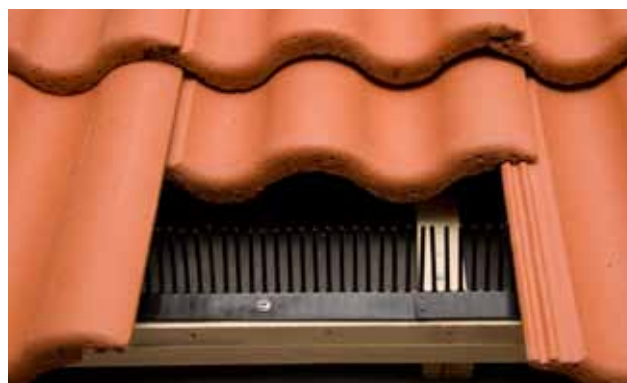
Bild 2. Montering av Fågelband